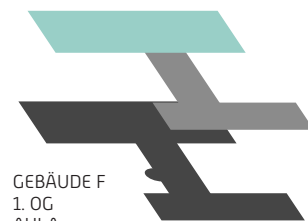
GEBÄUDE F 1. OG AULA